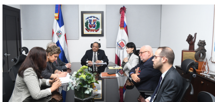
Visita al presidente del Tribunal Constitucional el magistrado Napoleón R. Estévez Lavandier