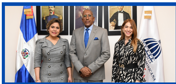
Visita al Contralor General de la República, el señor Félix Santana García