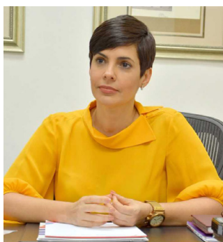
YOLANDA MARTÍNEZ Z. (Presidenta Consejo Directivo Procompetencia)

Este primer boletín de ProCompetencia inaugura un año lleno de retos e incertidumbre, a medida que la amenaza de la pandemia del COVID-19 se expande y se acerca a nuestro territorio. Para el 2020 habíamos vislumbrado grandes planes coincidentes con la presidencia Pro Tempore de